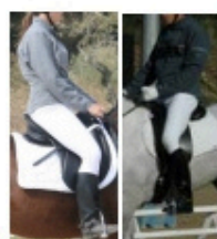
Classic dress : 8 points