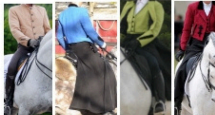
14 points with classical boots and trousers