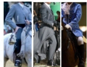
16 points FULL DRESS