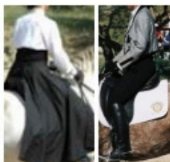
12 points PART DRESS